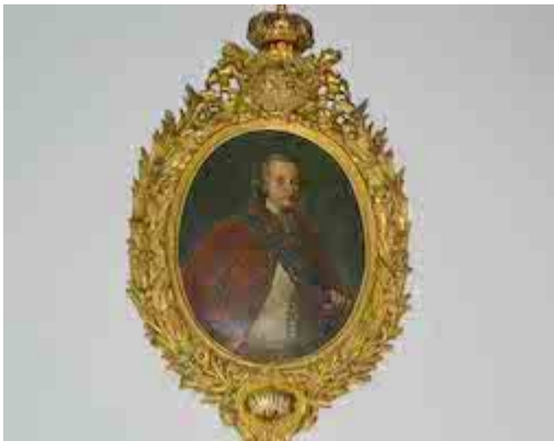
Portrait of Carlos IV. Félix Padrón (1789). Town hall of San Cristóbal de la Laguna