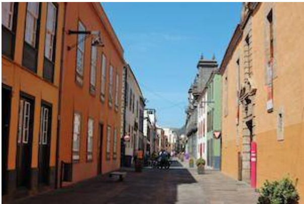
Real de San Agustín street