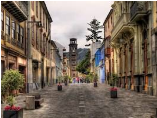
La Carrera street