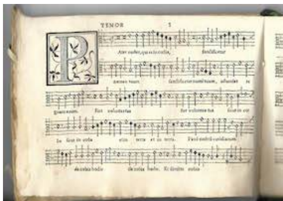
Pater noster. Sacrae cantiones. Francisco Guerrero. Tenor booklet. Real Academia de Bellas Artes de San Fernando (Madrid). Biblioteca, A-2411-A-2415

"http://www.youtube.com/embed/M5i0B0FKtdM?iv_load_policy=3&fs=1&origin=http://www.historicalsoundscapes.com"