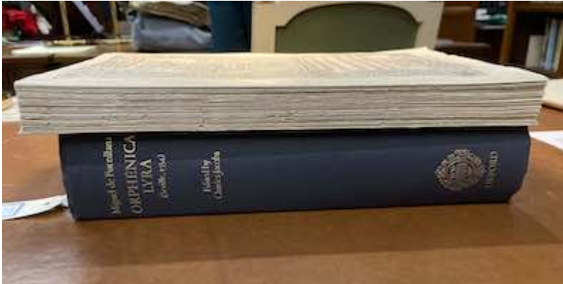
Orphenica lyra. Miguel de Fuenllana [E-Mba PA-2] (serraduras)