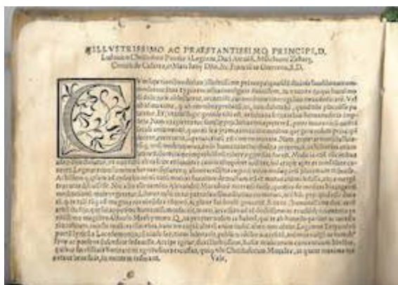
Sacrae cantiones. Francisco Guerrero. Dedication tenor booklet. Real Academia de Bellas Artes de San Fernando (Madrid). Biblioteca, A-2411-A-2415