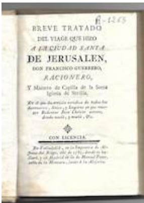
Breve tratado del viage que hizo a la ciudad Santa de Jerusalem. Francisco Guerrero. Real Academia de Bellas Artes de San Fernando (Madrid). Biblioteca, A-1792