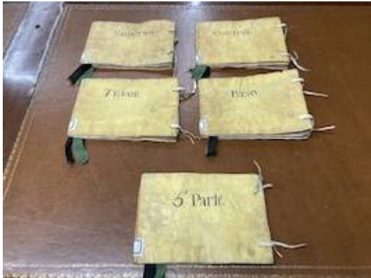
Sacrae cantiones . Francisco Guerrero. Booklet's covers . Real Academia de Bellas Artes de San Fernando (Madrid). Biblioteca, A-2411-A-2415