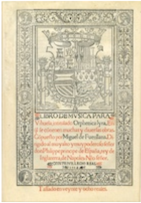
Orphenica lyra. Miguel de Fuenllana [E-Mba PA-2]