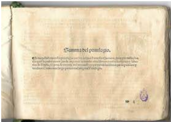
Sacrae cantiones . Francisco Guerrero. Print privilege tenor booklet. Real Academia de Bellas Artes de San Fernando (Madrid). Biblioteca, A-2411-A-2415