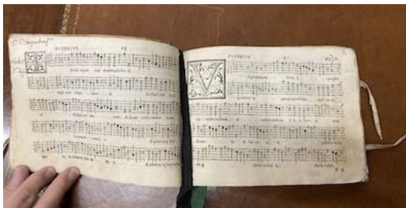
Sacrae cantiones. Francisco Guerrero. Notation in librete Superior. Real Academia de Bellas Artes de San Fernando (Madrid). Biblioteca, A-2411-A-2415