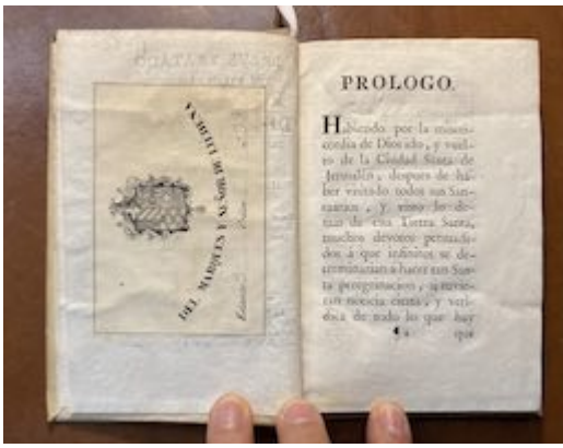
Breve tratado del viage que hizo a la ciudad Santa de Jerusalem. Francisco Guerrero. Real Academia de Bellas Artes de San Fernando (Madrid). Biblioteca, A-1792 (exlibris)