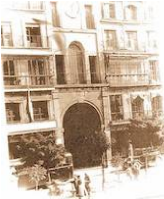
Chapel of the Arco de la Sangre (before 1936)