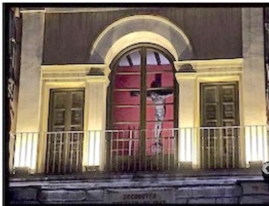
chapel of the Arco de la Sangre