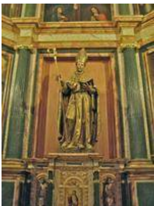
Saint Ildefonsus (1603). Bernabé de Gaviria (sculptor). Blas de Ledesma (painter).