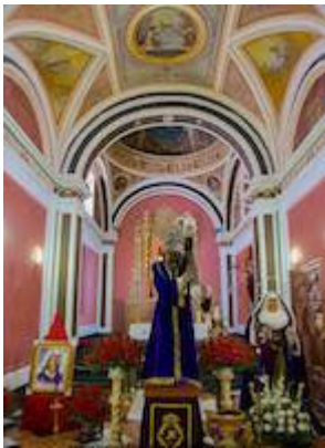
Chapel of Jesús Nazareno. Church of Santa Marta