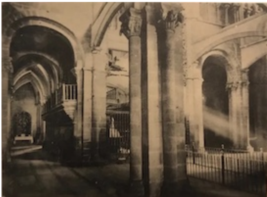
Interior of the cathedral of Tuy (Pontevedra). Partial view of the old choir