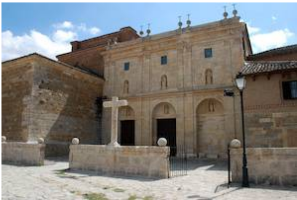
convent of Santa Clara