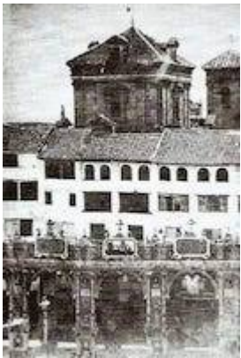
Church of Santa María Magdalena (view from Bibarramba square)