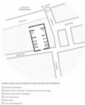
Location of the confraternities at the church of Santa María Magdalena