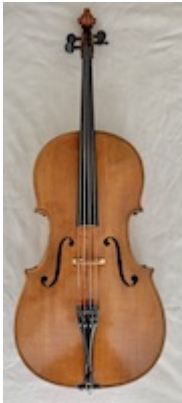
Cello (particular collection).