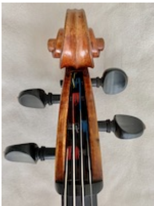
Scroll and pegbox. Cello (particular collection).