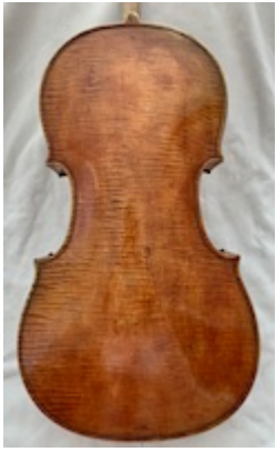
Back plate. Cello (particular collection).

"http://www.youtube.com/embed/OFXw3xelnog?iv_load_policy=3&fs=1&origin=http://www.historicalsoundscapes.com"