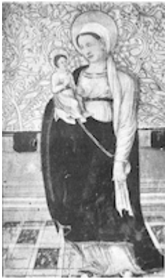
Panel painting of the Virgin from the old altarpiece in the chapel of San Miguel. Maestro de Liedó