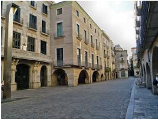
Plaça del Vi