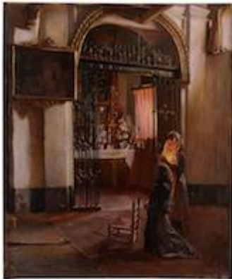
La capilla del Cristo de la Luz . Joaquín Capulino Jáuregui (1916)