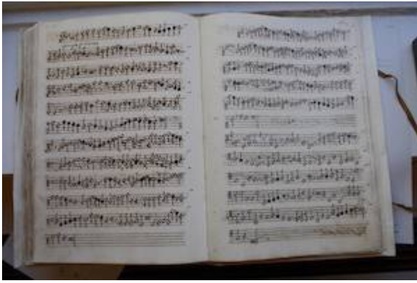
Quinque prudentes virgines a 4. [Pedro Guerrero]. E-GRmf 975, fols. 161v-162r