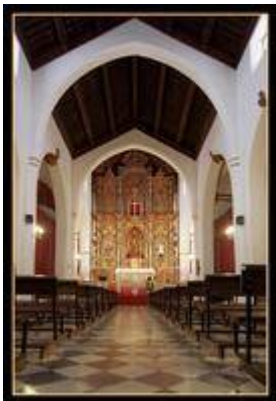
Interior of the church of San Miguel.