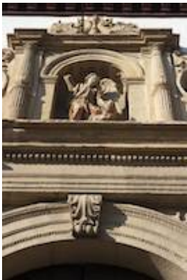
Church of San Miguel. Description of the building and some historical facts