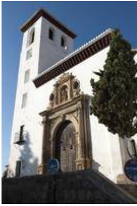
Church of San Miguel.