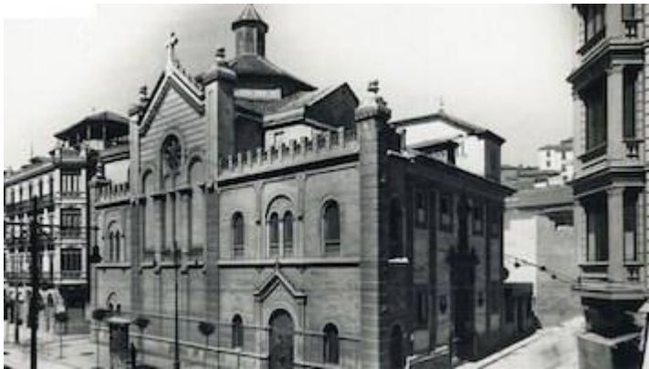
Convent of the Ángel Custodio