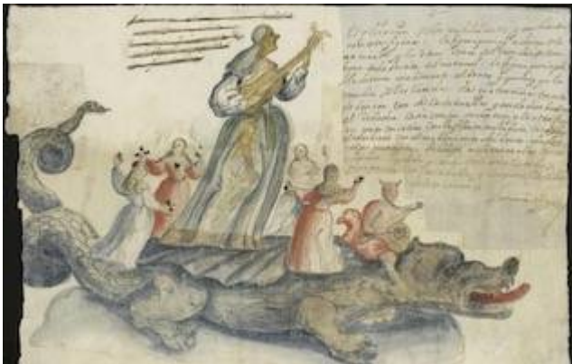
Tarasca. Madrid (1685)