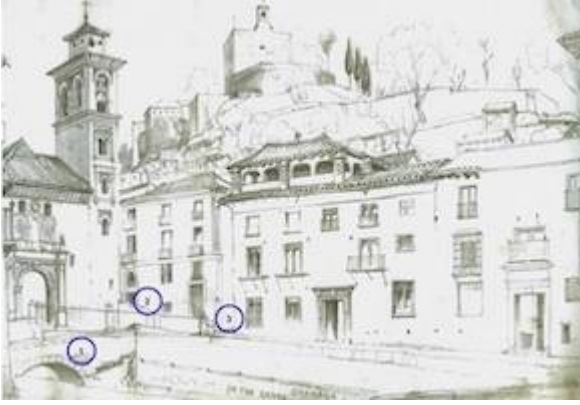
Santa Ana. Edward Cook (1861): 1. Bridge of Santa Ana / 2. Ascent to the Molino de Santa street / 3. Descent from the alley of San Onofre