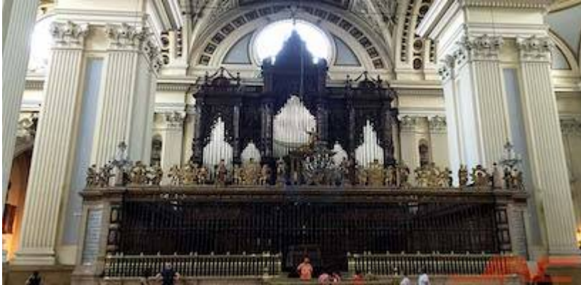
Choir of the old collegiate church of Santa María la Mayor y del Pilar.