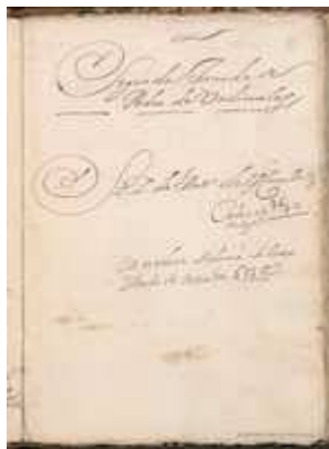
Annotation in the manuscript of La gran comedia de Pedro de Urdemalas (fol. 25r)