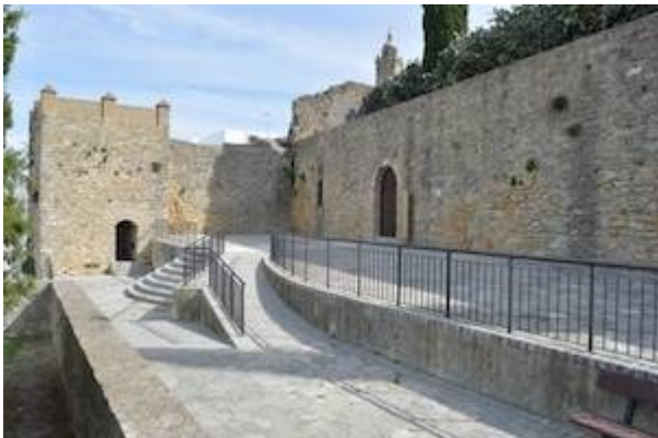
Space occupied by the Corral de Comedias of the Duke of Medina Sidonia