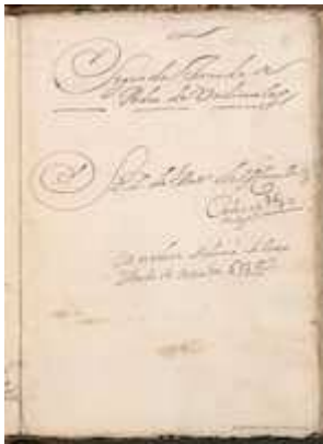
Annotation in the manuscript of La gran comedia de Pedro de Urdemalas (fol. 25r)