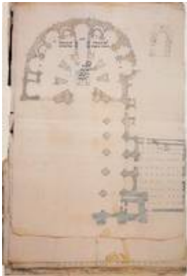
Annotated plan of the Cathedral and Tabernacle (1594). Juan de la Vega