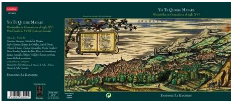
Pane me ami duche. Thomas Créquillon. Yo te quiere matare. Ministriles en Granada en el siglo XVI . Ensemble La Danserye. Lindoro. NL-3019

https://www.historicalsoundscapes.com/recursos/1/5/pane-me.mp3