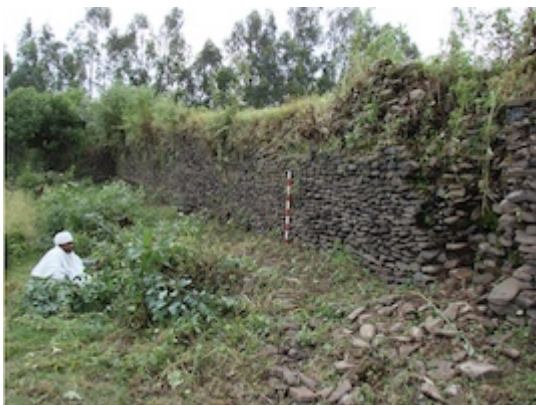
Remains of the northern side of the fortified enclosure of the Gännätä Iyäsus church.