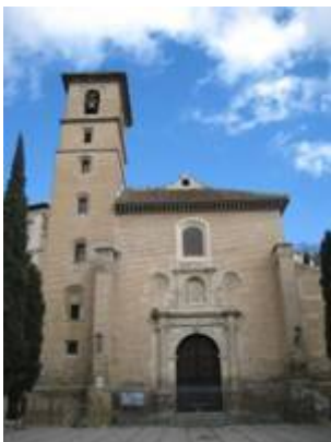
Church of San Ildefonso.