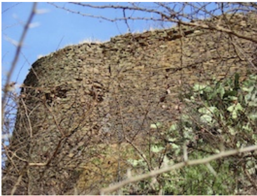
Remains of the fortress of Fremona (Adwa) –detail–.