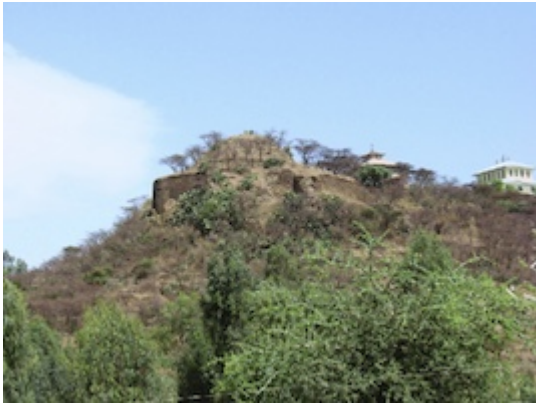
Remains of the fortress of Fremona (Adwa).