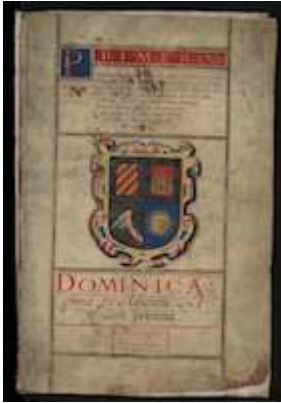
Biblioteca Nacional de España, MpCant/25, [fol. 1r]