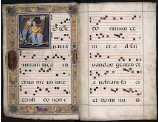
Biblioteca Nacional de España, MpCant/25, [fols. 1v-8r]