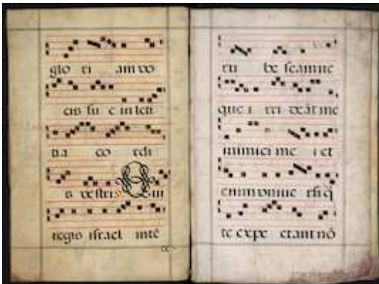
Biblioteca Nacional de España, MpCant/25, [fols. 8v-11r]