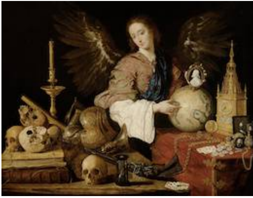
Alegoría de la Vanidad. Antonio de Pereda y Salgado (1632-1636)