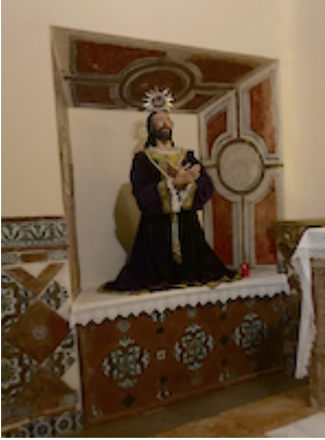
Jesus at the Prayer Garden. Convent of San Antón.