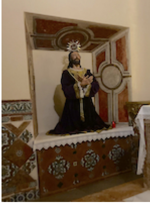
Jesus at the Prayer Garden. Convent of San Antón.