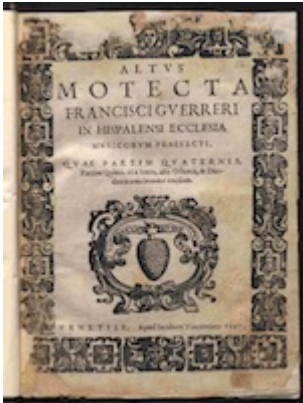
Title page Altus partbook [E-Bim 67]