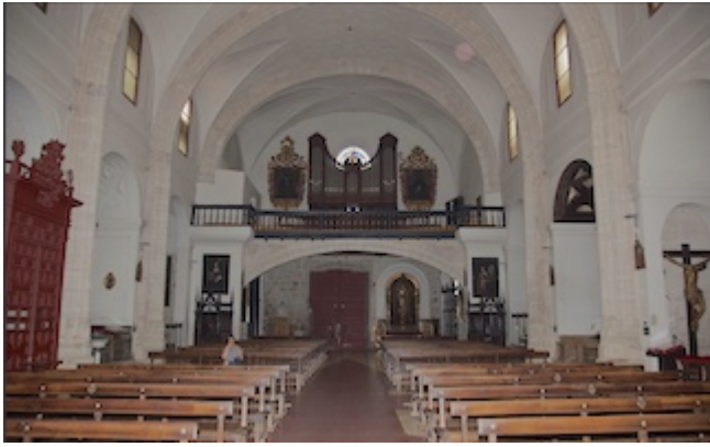
Choir of the church of Santiago