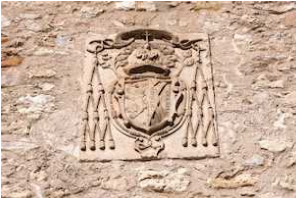
College of San Buenaventura (coat of arms of fray Pedro Gonzalez de Mendoza)