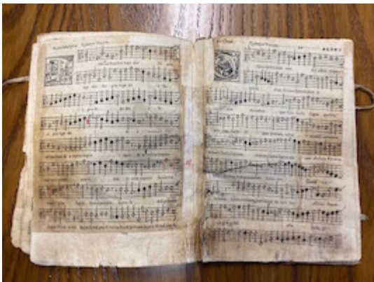
Motteta . Francisco Guerrero. Venecia: apud filios Antonii Gardani, 1570). [E-GRcr]

http://www.youtube.com/embed/MEBd9hVuD28?iv_load_policy=3&fs=1&origin=http://www.historicalsoundscapes.com