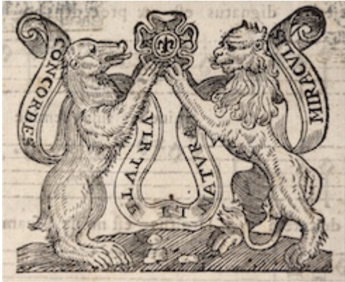
The Gardano music printing firms