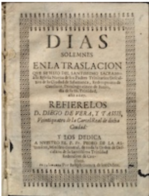
Días solemnes.... Diego de Vera y Tasis (title page)