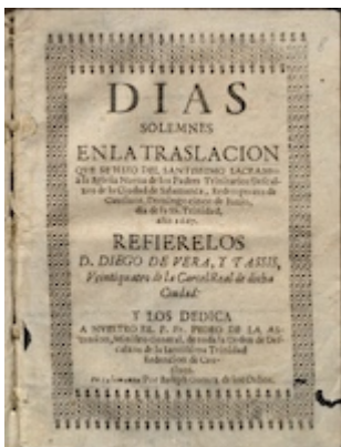
Días solemnnes.... Diego de Vera y Tasis (title page)