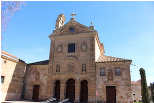
church of the Trinitarios descalzos