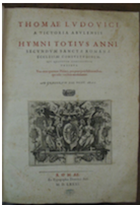
Hymni totius anni . Tomás Luis de Victoria. Roma, 1581.