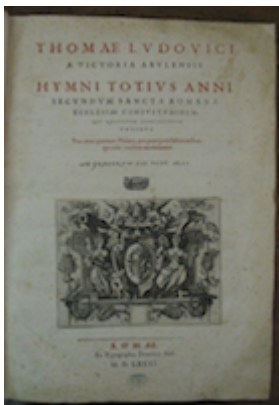
Hymni totius anni . Tomás Luis de Victoria. Roma, 1581.