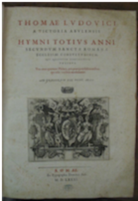
Hymni totius anni . Tomás Luis de Victoria. Roma, 1581.