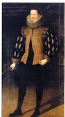
Portrait of Ruy Gómez de Silva Mendoza, 3rd Duke of Pastrana. Bartolomé González Serrano (1564-1627)

"https://embed.spotify.com/?uri=https://open.spotify.com/track/2Q2SJ2wO1uBz1LGHN89RDe