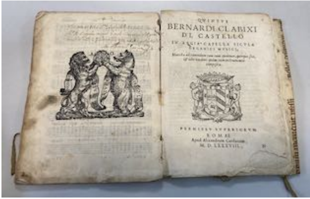
Motteta. E-V Impreso VIII [97]. Quinta et sexta pars

"http://www.youtube.com/embed/6Xo-o3RMVQ0?iv_load_policy=3&fs=1&origin=http://www.historicalsoundscapes.com"