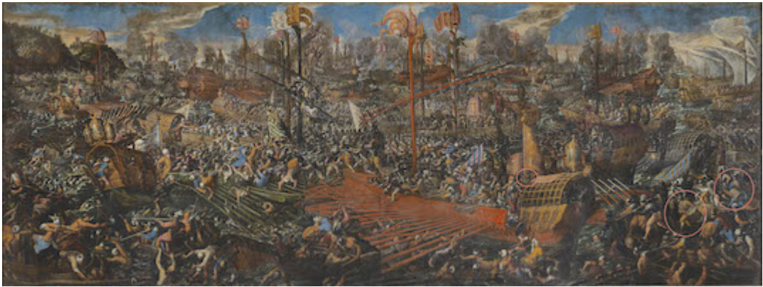
Lepanto battle. Andrea Vicentino (1580)