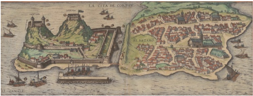
Port of Corfu. Civitatis orbis terrarum , vol. 2 (1575)