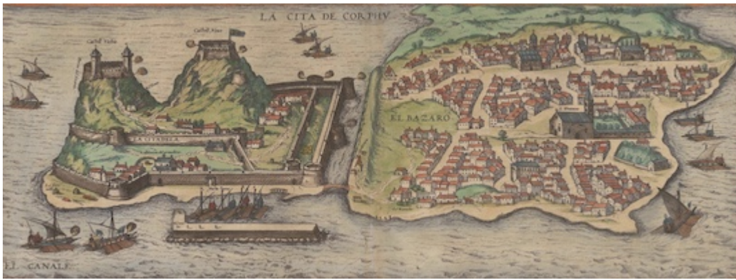
Port of Corfu. Civitatis orbis terrarum , vol. 2 (1575)