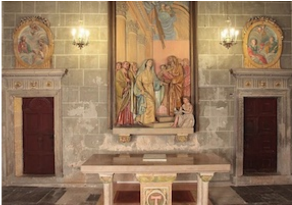
Capilla de la Presentación Catedral de Tarragona