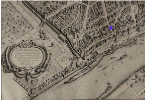
Buchgasse. Map by Matthäus Merian the Elder (1628)