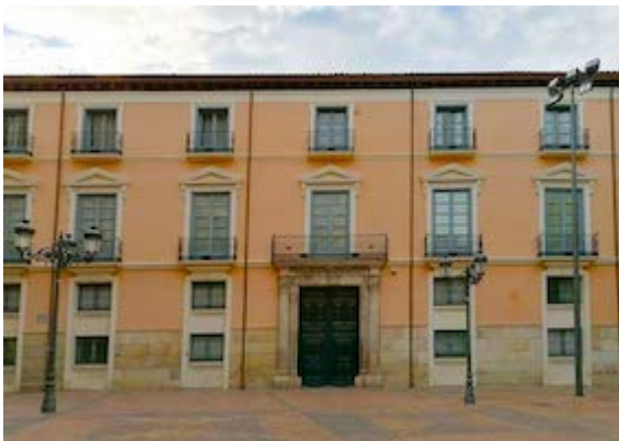
Palace of the Counts of Sobradiel