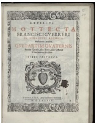
Superius. Mottecta . Francisco Guerrero (1589) [D-Kl 4° Mus. 1]