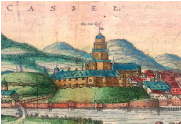
Castle of the landgraves of Hesse-Kassel. Brown & Hogenberg (1572)