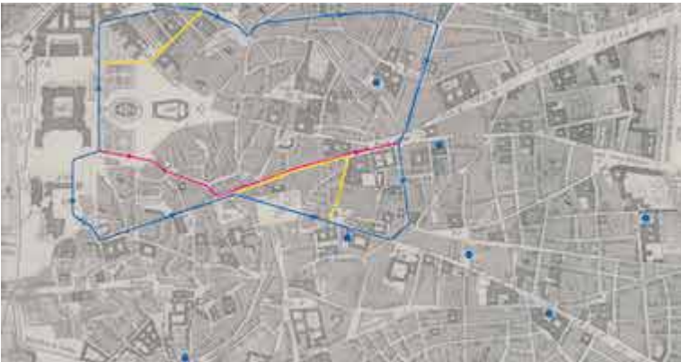
Changes in the itinerary of the Good Friday procession in Madrid (1804-1816)