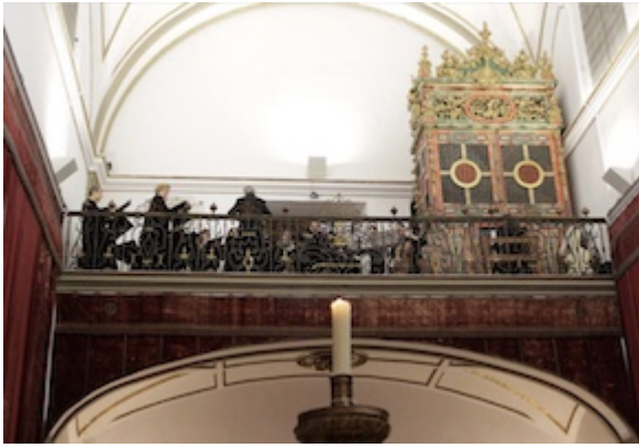
Organ tribune in the chapel of San Jerónimo