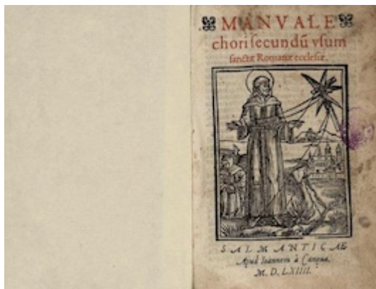
Manuale chori. Salamanca: Juan de Cánova, 1564