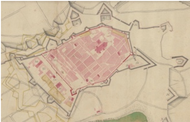
Plano de la plaza de Tarragona (s. XVIII). Nº 30. Convent of Santa Clara