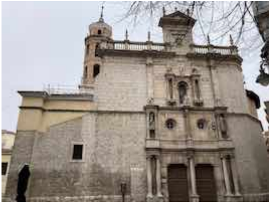
Church of San Salvador.