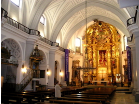
Church of San Salvador (inside)