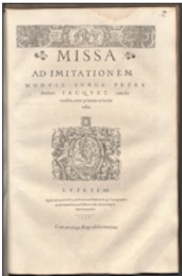
Missa ad imitationem moduli Surge Petre, auctore Jacquet cum sex vocibus. Jacquet of Mantua (1557)