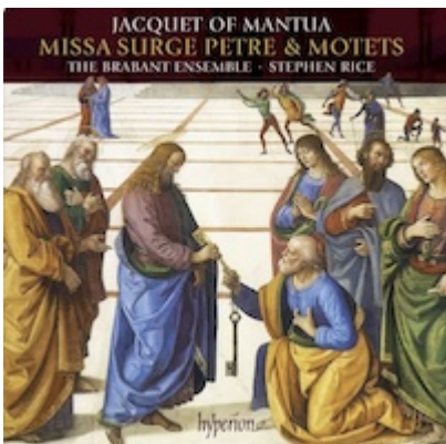
Missa Surge Petre. Jacquet of Mantua