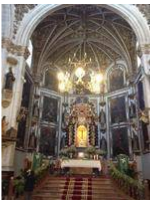
Convent of Santa Cruz la Real (inside)