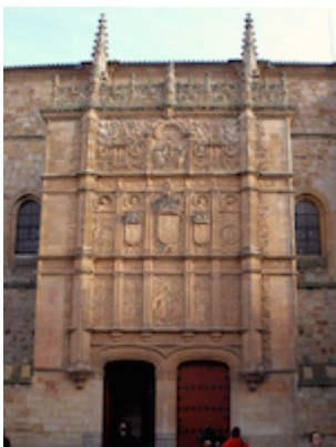
Façade of the University of Salamanca