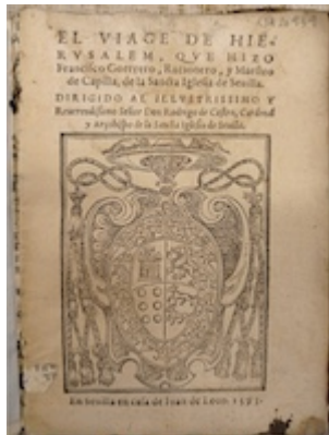
Title page. El viaje de Jesusalén . Francisco Guerrero (Sevilla, 1593)

"https://embed.spotify.com/?uri=spotify:track:3G4JwlggHq4nXvQMGKZuHq"