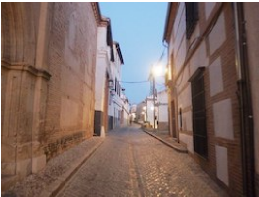
San Juan de los Reyes street