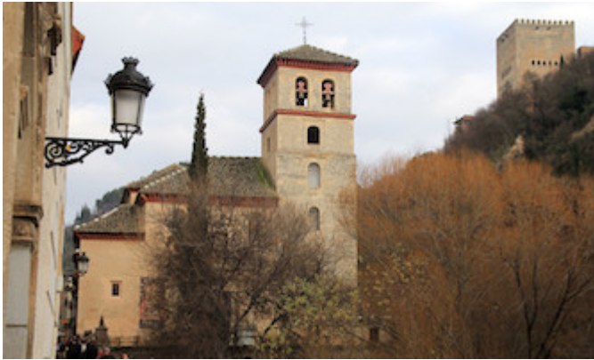
Church of San Pedro y San Pablo