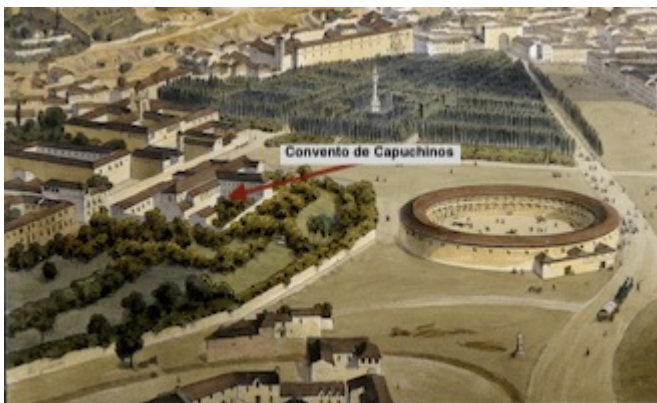
Convento of San Juan de la Penitencia