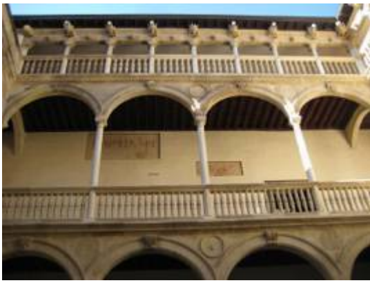
Gallery of the Colegio Real (Universidad de Granada).