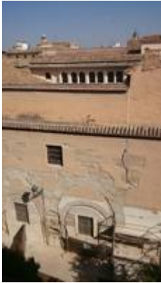
Remains of the old church of the Santos Justo y Pastor.